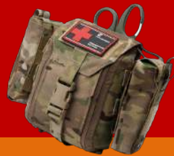
2 – РАСШИРЕННАЯ Само- и взаимопомощь (Желтая зона)