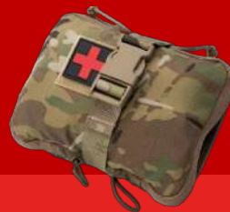
1 – САМОПОМОЩЬ (красная зона)